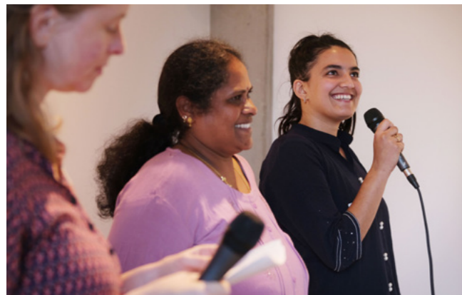
Klimaaktivist:innen aus Indien und Berlin im Austausch.

Mit seinen vielen positiven Beispielen aus der Praxis setzt der Faire Handel Impulse für nachhaltiges Wirtschaften und die Veränderung politischer Rahmenbedingungen.